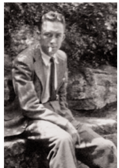
Albert Camus à Saint-Etienne en 1943.

BAIE DES ANGES tél/fax : 04 97 07 06 06 - baiedanges@wanadoo.fr www.baiedesanges-editions.com